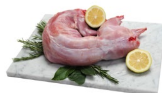
CONIGLIO NAZIONALE CASSA al kg