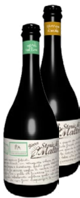
STORIEDI MALTO Birra Assortita cl 33