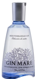
GIN MARE Gin Mediterranean cl 70