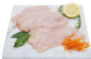
FETTINE DI POLLO al kg