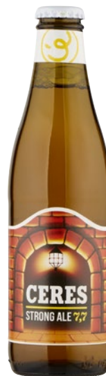
CERES Birra Strong Ale 7,7 cl 33