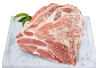
COPPA DI SUINO DISSOSSATA al kg