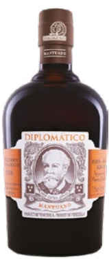
DIPLOMATICO Ron Mantuano 40 cl 70