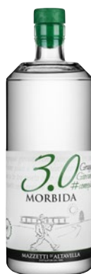
MAZZETTI D'ALTAVILLA 3.0 Grappa Morbida cl 70