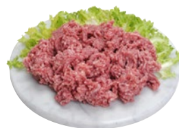
MACINATO DI SUINO al kg