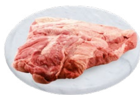
PANCIA BOVINO ADULTO TRANCI al kg