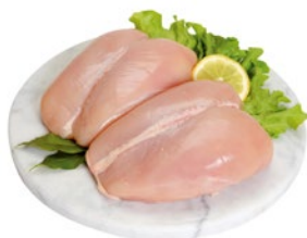
PETTO DI POLLO al kg