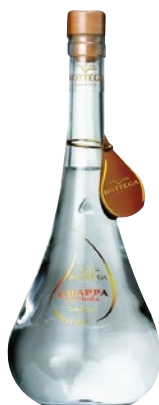
BOTTEGA Grappa Sandoro cl 70