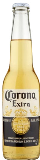
CORONA Birra Lager Messicana cl 33