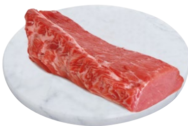
FILONE DI SUINO al kg