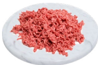
IMPASTO CONDITO BOVINO/SUINO al kg