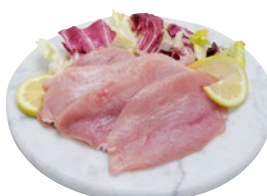
FESA DI TACCHINO A FETTE al kg