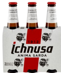
ICHNUSA Birra di Sardegna 3 bott x cl 33