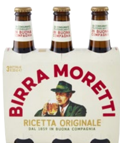
MORETTI Birra 3 bott x cl 33