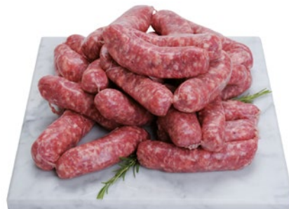
SALSICCIA GROSSA al kg