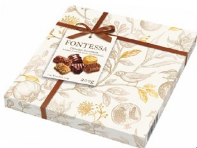
LUDWIG Praline Fontessa g 200