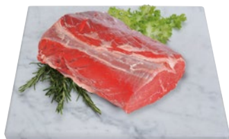
ENTRECOTE DI BOVINO ADULTO al kg