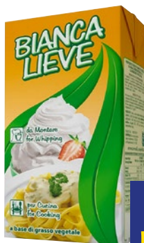
BIANCALIEVE Preparato Vegetale litri 1