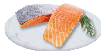
SALMONE KETA PORZIONI 180-200 kg 4