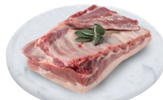
PANCETTA DI SUINO al kg