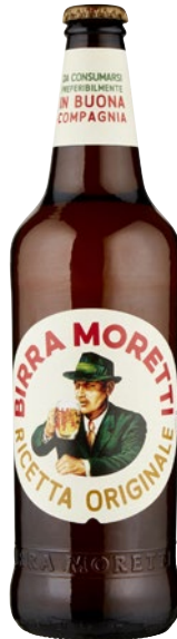
MORETTI Birra Ricetta Originale cl 66