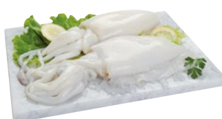
SEPIA INDOPACIFICA 60UP g 800