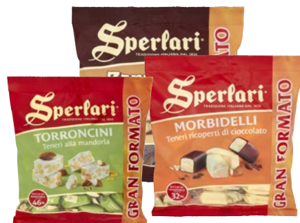
SPERLARI Torroncini g 320