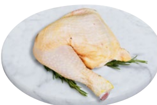
QUARTO DI POLLO POSTERIORE al kg