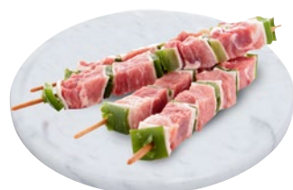
SPIEDINI DI SUINO MINI al kg