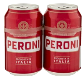
PERONI Birra 2 latt x cl 33