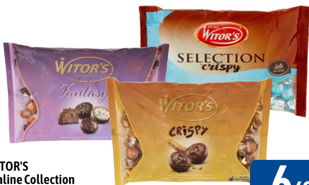
WITOR'S Praline Collection kg 1