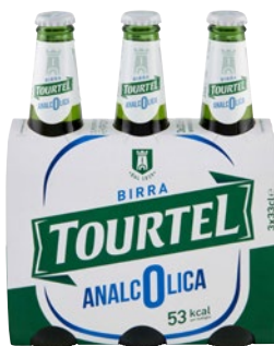
TOURTEL Birra Analcolica 3 bott x cl 33