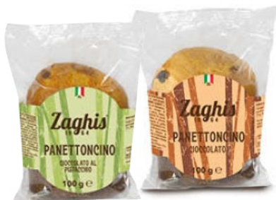
ZAGHIS Panettoncini Farciti g 100