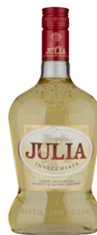
JULIA Grappa Invecchiata cl 70