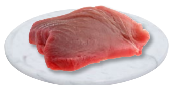
SCALOPPE TONNO PINNE GIALLE g 900