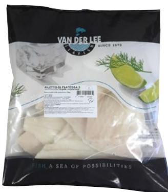
FILETTO PLATESSA g 750