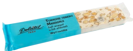
DOLCITAL Torrone Tenero alle Mandorle g 180