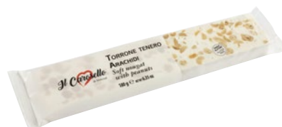
IL CAROSELLO Torrone Tenero Arachidi g 180