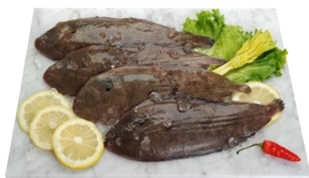
SOGLIOLA OCEANICA kg 5