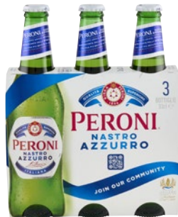
PERONI Birra Nastro Azzurro 3 bott x cl 33