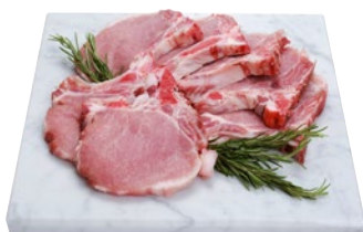
BRACIOLE DI SUINO al kg