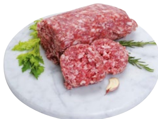
IMPASTO DI SALSICCIA al kg