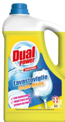
DUAL POWER Detergente Lavastoviglie Acque Medie litri 5