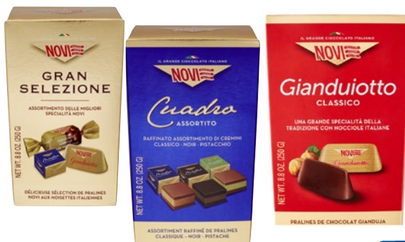
NOVI Cioccolatini Assortiti g 250