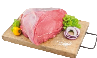
NOCE DI VITELLO al kg