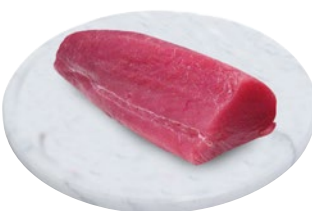
FILONE TONNO PINNE GIALLE al kg