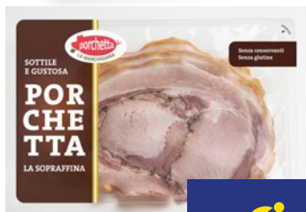
SIGNORACCI Porchetta a Fette g 250