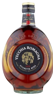
VECCHIA ROMAGNA Etichetta Nera cl 70