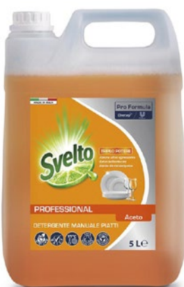
SVELTO PROFESSIONAL PIÙ Detergente Piatti Aceto litri 5