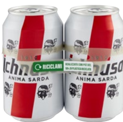
ICHNUSA Birra Lager 2 latt x cl 33