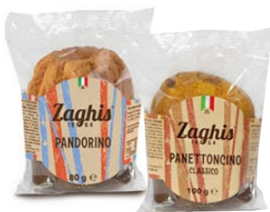
ZAGHIS Panettoncini/ Pandorini Classici g 100/80