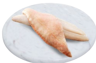
FILETTO DISCORFANO ATLANTICO CON PELLE g 800