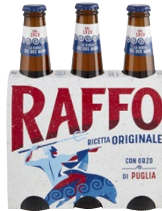
RAFFO Birra con Orzo di Puglia 3 bott x cl 33