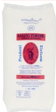
ELEFANTE BAKING Agente Lievitante kg 5