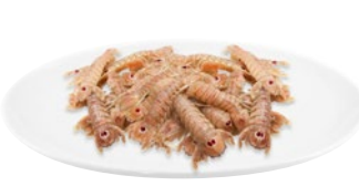
PANNOCCHIA CRUDA IQF kg 2,13