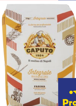
CAPUTO Integrale Farina di Grano Tenero kg 5