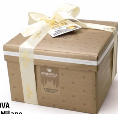
GIOVANNI COVA Panettone di Milano kg 1