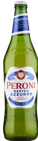
PERONI Birra Nastro Azzurro cl 62