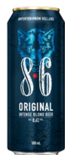
8.6 Birra Extra Strong cl 50