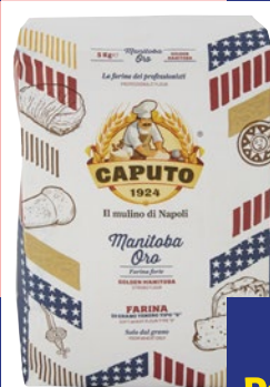
CAPUTO Manitoba Oro Farina di Grano Tenero Tipo "0" kg 5