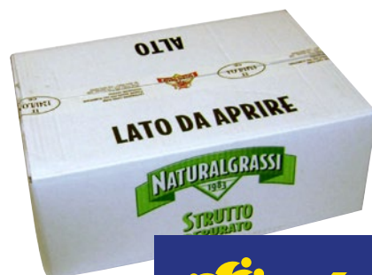
NATURALGRASSI Strutto Depurato kg 10