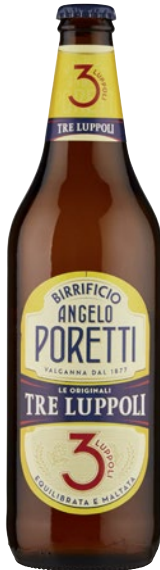
ANGELO PORETTI Birra 3 Luppoli cl 66