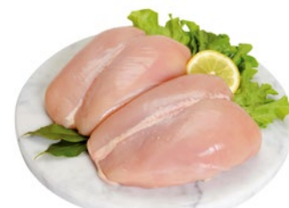
PETTO DI POLLO al kg