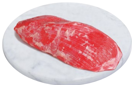
GIRELLO BOVINO al kg