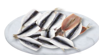
FILETTI ALICI g 900