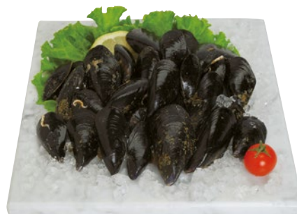
COZZE CON GUSCIO PRECOTTE kg 1