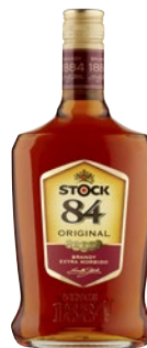
STOCK84 Original cl 70