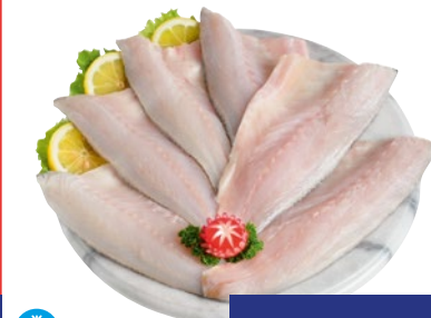
FILETTO DI BRANZINO 80/120 kg 3,75