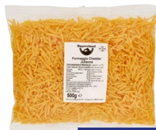
BAYERNLAND Formaggio Cheddar Julienne g 500