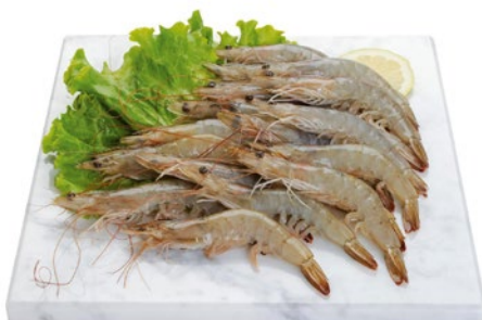
MAZZANCOLLE TROPICALI INTERE 30/40 kg 1,8