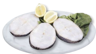
TRANCE MERLUZZO ATLANTICO 90/150 g 900