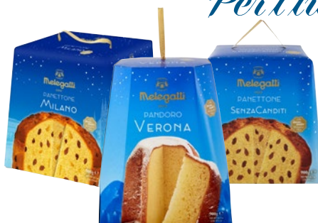
MELEGATTI Panettone/ Pandoro g 900