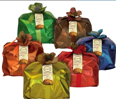
GIAMPAOLI Panettone Arcobaleno kg 1