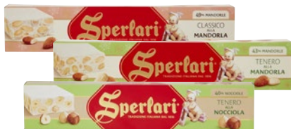
SPERLARI Torrone Mandorla/ Nocciola/ Pistacchio Classico/Morbido g 250