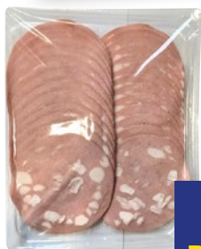
SAN MICHELE Mortadella g 250