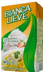
BIANCA LIEVE Panna da Montare a Base di Grasso Vegetale litri 1