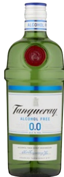
TANQUERAY Alcohol Free 0.0% cl 70