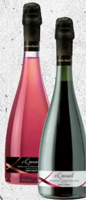
MEDICI Lambrusco Reggiano DOC cl 75