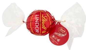
LINDT LINDOR Maxi Boule Cioccolatini al Latte g 250