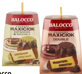
BALOCOCCO Panettone/ Pandoro Maxi Cioc g 800