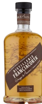
DISTILLERIE FRANCIACORTA Grappa di Amarone Barricata 12 Mesi cl 50