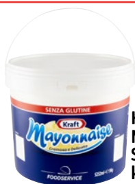
KRAFT Mayonnaise Senza Glutine kg 5