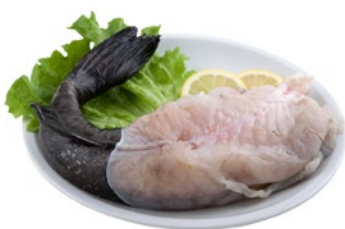
CODE RANA PESCATRICE PACIFICO 200-300 kg 1,6