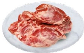
SPALLA DI SUINO SENZA OSSO al kg