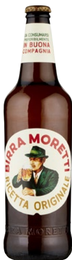
MORETTI Birra Ricetta Originale cl 66