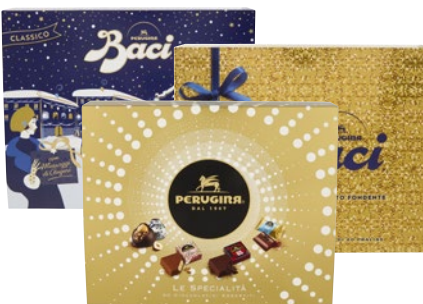
BACI PERUGINA Cioccolatini Ripieni Scatola Regalo g 295/250