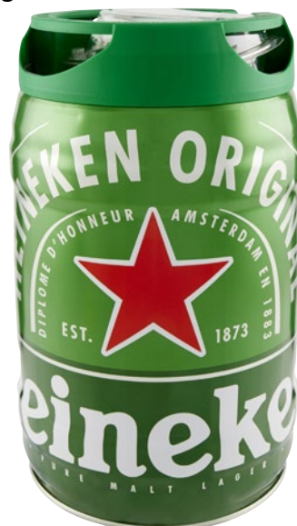
HEINEKEN Original Birra Fusto litri 5