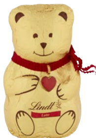
LINDT Orsetto di Cioccolato al Latte g 100