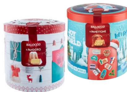
BALOCOCCO Panettone/ Pandoro g 750