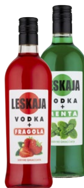
LESKAJA Vodka alla Frutta cl 70