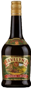
EVELYN Original Cream Whisky cl 70