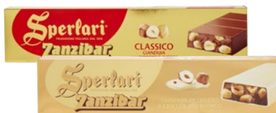
SPERLARI Torrone Zanzibar g 250