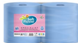
BOBINA AZZURRA 2 VELI 800 STRAPPI