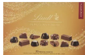
LINDT Scatola Regalo Cioccolatini Dolci Capolavori g 377