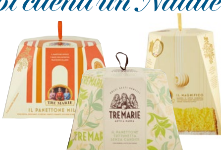
TRE MARIE Panettone/ Pandoro kg 1