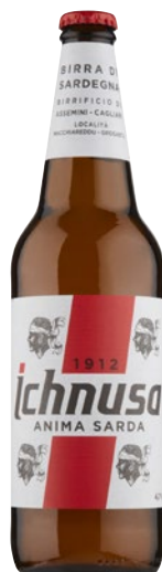
ICHNUSA Birra cl 66