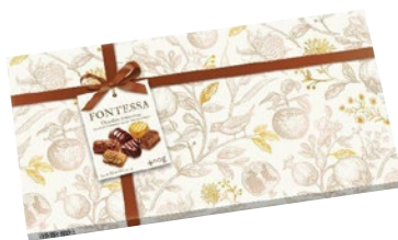
FONTESSA Praline Ludwing g 400