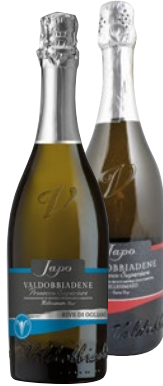
JAPO Prosecco Millesimato DOCG cl 75