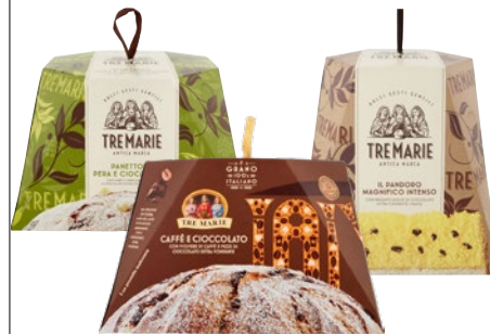
TRE MARIE Panettone/ Pandoro Farcito kg 1/g 930