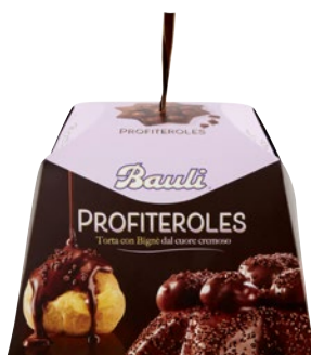
BAULI Torta Profiteroles g 750