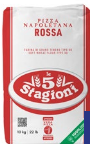
LE 5 STAGIONI Farina di Grano Tenero "00" per Pizza Napoletana kg 10