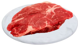
SCAMONE BOVINO ADULTO ARGENTINA al kg