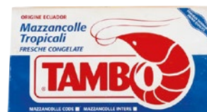
CODE DI MAZZANCOLLE TROPICALI 41/50 kg 1,5