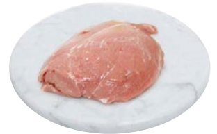
SCAMONE VITELLO al kg