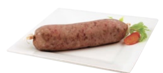
COTECHINO al kg