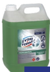
LYSOFORM Detergente freschezza alpina litri 5