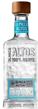
OLMECA Tequila Altos Plata cl 70