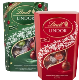
LINDT Cioccolatini Lindor g 337