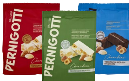
PERNIGOTTI CHERUBINI Torroncini Morbidi Riciperti g 117