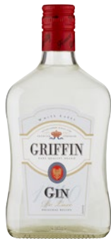
GRIFFIN Gin De Lux cl 70