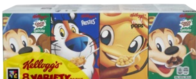
KELLOGG'S 8 Variety Packs g 215