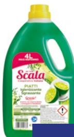
SCALA Detergente Piatti a Mano litri 4