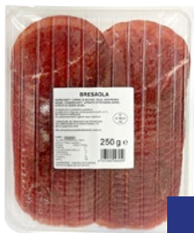
SAN MICHELE Bresaola g 250