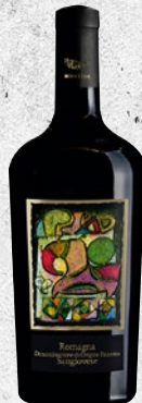
MONTAIA Sangiovese Romagna DOP cl 75