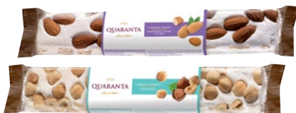
QUARANTA Torrone Soffice con Mandorle/ Nocciole g 180