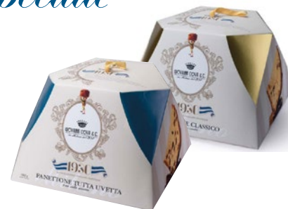
GIOVANNI COVA & C. Panettone kg 1