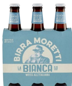
MORETTI Birra La Bianca 3 bott x cl 33