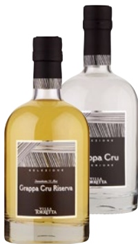
VILLA TORRETTA Grappa Cru Riserva/ Superiore cl 50