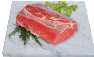
ENTRECOTE DI BOVINO ADULTO al kg