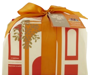
TRE MARIE Il Panettone Incartato kg 1