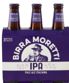
MORETTI Birra Ipa Pale Ale 3 bott x cl 33