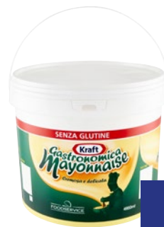
KRAFT Mayonnaise Gastronomica Senza Glutine kg 5