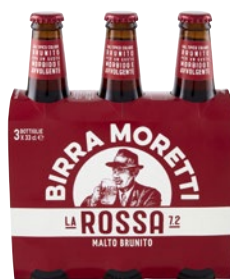
MORETTI Birra La Rossa 3 bott x cl 33