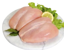
PETTO DI POLLO al kg