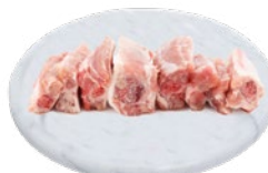
PUNTINE LOMBO SUINO al kg