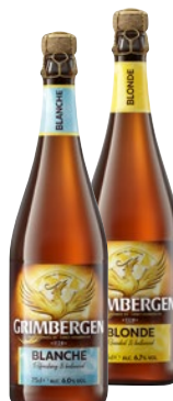
GRIMBERGEN Birra Blonde/ Blanche cl 75