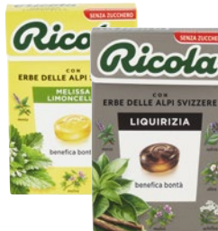
RICOLA Caramelle g 50