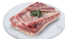
PANCETTA DI SUINO al kg