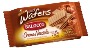
BALOCCO Snack Hazelnut Wafers g 45