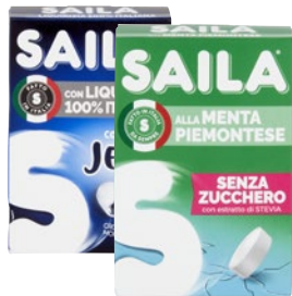
SAILA Caramelle alla Menta/Liquirizia g 40