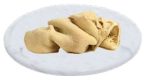
TRIPPA BOVINO al kg