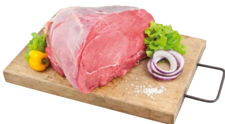
NOCE DI VITELLO al kg