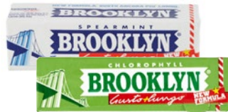
BROOKLYN Chewing Gum Stick g 28