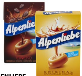
ALPENLIEBE Caramelle Senza Zucchero Espresso/ Caramel g 49