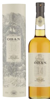
OBAN Single Malt Scotch Whisky cl 70