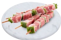
SPIEDINI DI SUINO MINI al kg