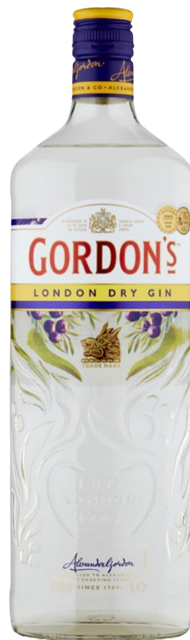
GORDON'S London Dry Gin litri 1