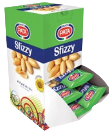
PATA Arachidi Sfizy 30 pz x g 30