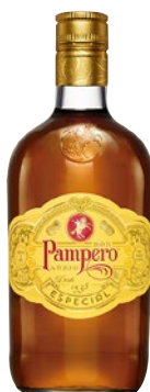
PAMPERO ESPECIAL Ron litri 1