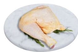
QUARTO DI POLLO POSTERIORE al kg