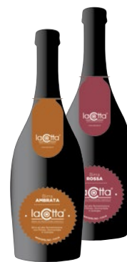
LA COTTA Birra Agricola cl 75