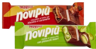
NOVI Novipiù Barrette di Cioccolato g 35/28