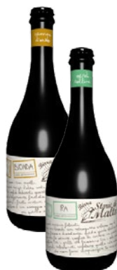
STORIE DI MALTO Birra cl 33