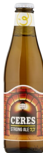
CERES Birra Strong Ale 7,7 cl 33