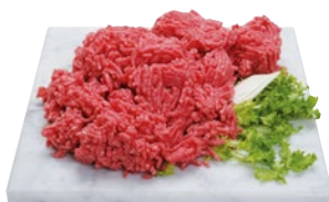
MACINATO DI SUINO/BOVINO al kg