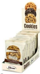
FALCONE Cookies Latte/ Gianduia 13 pz - g 650