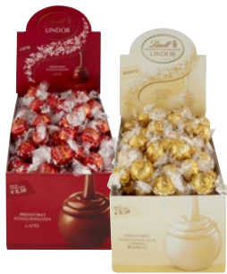
LINDT LINDOR Praline kg 1,2