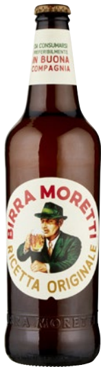
MORETTI Birra Ricetta Originale cl 66