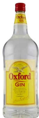
OXFORD Gin litri 2