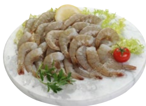
CODA MAZZANCOLLE TROPICALI 16/20 g 400