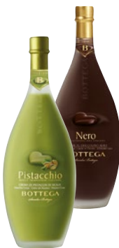
BOTTEGA Liquore al Pistacchio/ Cioccolato cl 50