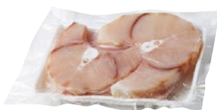
TRANCE VERDESCA 150/250 kg 5,4