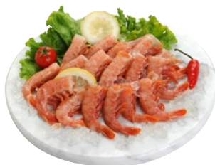
CODA GAMBERO ARGENTINO g 500