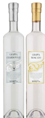
VILLA TORRETTA Grappa cl 50