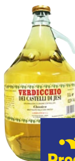
PIERSANTI Verdicchio dei Castelli di Jesi litri 5