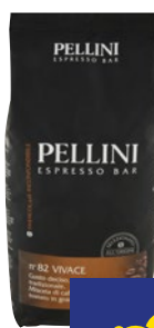
PELLINI Caffè Espresso Bar n 82 Vivace in Grani kg 1