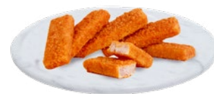
BASTONCINI DI MERLUZZO ALASKA kg 1