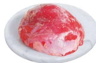
NOCE DI BOVINO al kg