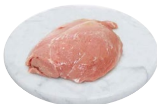
SCAMONE VITELLO al kg