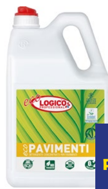
LOGICO ECO Detergente Pavimenti litri 5