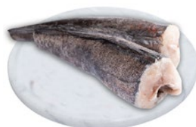
MERLUZZO SUDAFRICA HG 100/200 g 900