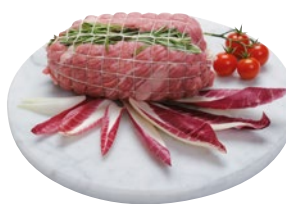
ROTOLO COLLO DI VITELLO al kg