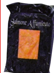
INEDITO Ritagli di Salmone Affumicato Atlantico g 500