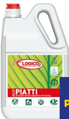
LOGICO ECO Detersivo Piatti litri 5