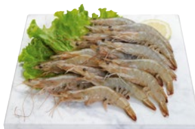
MAZZANCOLLE TROPICALI INTERE 30/40 kg 1,8