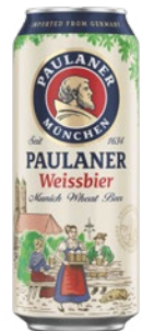
PAULANER Birra Weiss cl 50