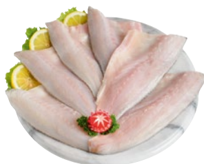
FILETTO DI BRANZINO 80/120 kg 3,75