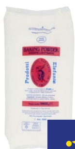
ELEFANTE BAKING Agente Lievitante kg 5