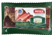
MOSER Speck Alto Adige IGP g 400