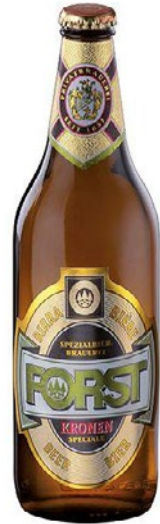
FORST Birra Kronen cl 66