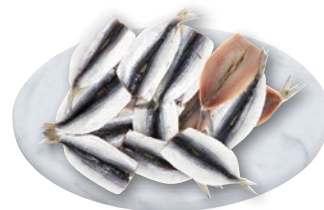
FILETTI ALICI g 900