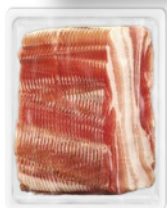
CHRISTANELL Pancetta Bacon g 250