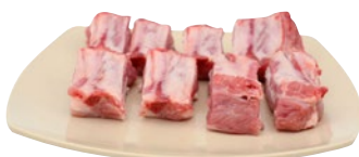
PUNTINE SUINO PORZIONATE al kg