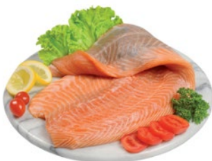
FILETTO DI SALMONE 1,8 al kg