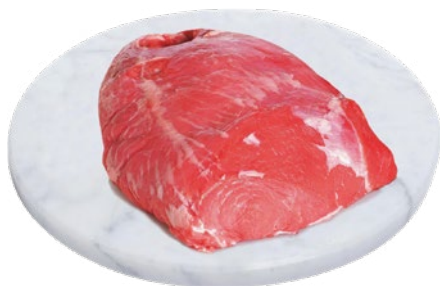
SCAMONE BOVINO ADULTO al kg