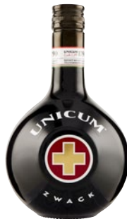
UNICUM Amaro cl 70