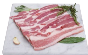
PANCETTA FETTE DI SUINO al kg