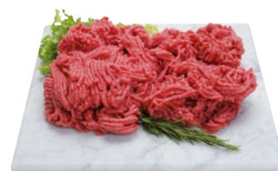
MACINATO DI BOVINO ADULTO al kg