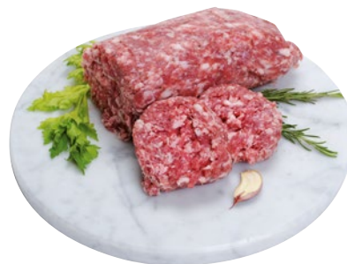
IMPASTO DI SALSICCIA DI SUINO al kg