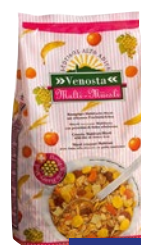
VENOSTA Müesli Multifrutta kg 1