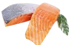
SALMONE KETA PORZIONI 180-200 kg 4