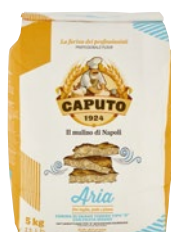
CAPUTO Farina di Grano Tenero Tipo "0" kg 5