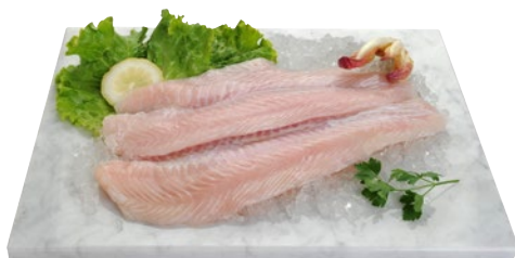
FILETTO PANGASIO g 800